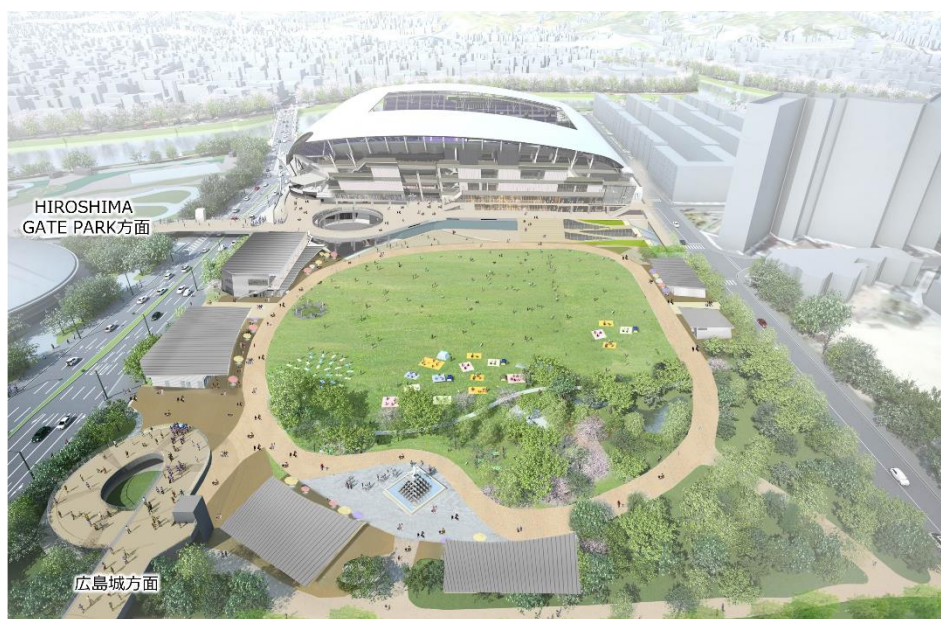
広場エリア東側からの鳥瞰イメージ

「中央公園広場エリア等整備・管理運営事業」（以下、本事業）を推進する事業者「ACTIVE COMMUNITY PARK」（代表法人：NTT 都市開発株式会社、事業主：株式会社エディオン、広島電鉄株式会社、株式会社 RCC 文化センター、株式会社中国新聞社、実施法人：NTT アーバンバリューサポート株式会社、株式会社 NTT ファシリティーズ、大成建設株式会社、日本工営都市空間株式会社、株式会社 UID）は、このたび広島県広島市中区基町 15 番地（広島市中央公園内、新サッカースタジアム隣地）において広場エリアの施設整備に着手したことから並びに広場エリア内に新設する商業施設名称を「HiroPa（ヒロパ）」に決定したことをお知らせします。なお、各整備施設の供用開始は2024年8月を予定しております。