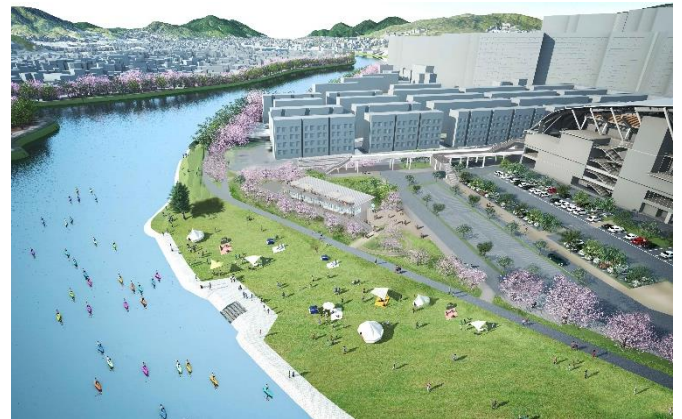
西側広場エリアの周辺イメージ