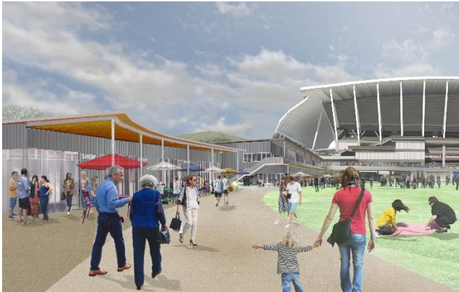
東側広場エリアの商業施設イメージ

東側広場エリアの各施設は、カフェ・レストラン、広島県内の特産品等を取り扱う店舗を予定しており、屋根や庇を水平基調で円形園路に沿った形状にすることで新サッカースタジアムとの一体感を生み出すとともに新サッカースタジアムと調和する外壁デザインとし、軒裏には一部県内産木材を使用することで温かみのある広場空間を演出します。また基町環境護岸に隣接する西側広場エリアには、水辺のアクティビティ拠点となる空間やバービューレストラン等を整備します。